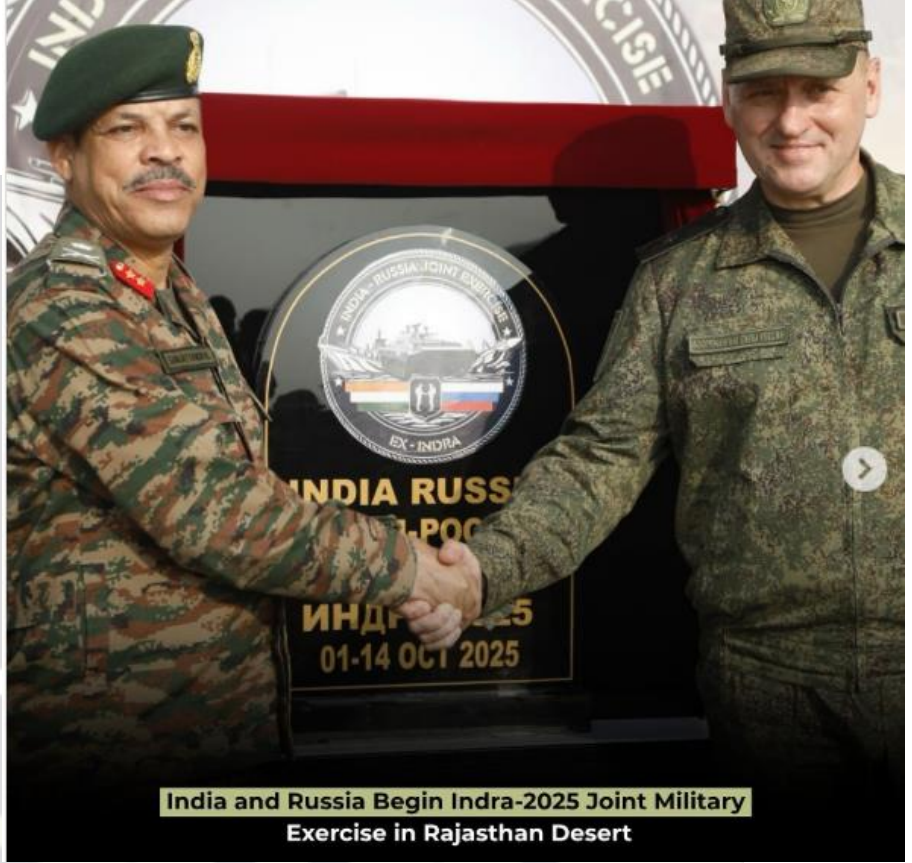
India and Russia Begin Indra-2025 Joint Military Exercise in Rajasthan Desert