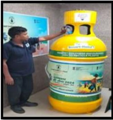
AI बिनस, CIL