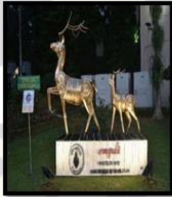
अपशिष्ट से कला, CMPDI