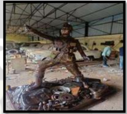
अपशिष्ट से कला, BCCL